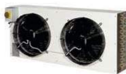
ITMZBT (jednostka zewnętrzna)

Seria osuszaczy niskotemperaturowych ITMBT to wysokowydajne urządzenia zaprojektowane specjalnie dla chłodni niskotemperaturowych, wszędzie tam gdzie poziom wilgotności powinien być kontrolowany podczas przechowywania produktów.