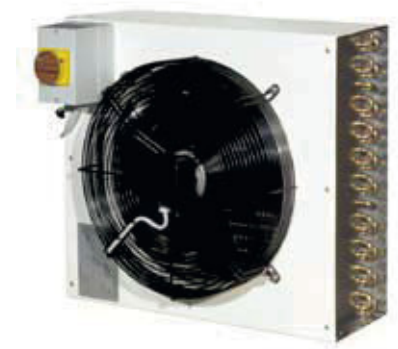
EHZBT (jednostka zewnętrzna)

Seria osuszaczy niskotemperaturowych EHBT to wysokowydajne urządzenia zaprojektowane specjalnie dla chłodni niskotemperaturowych, wszędzie tam gdzie poziom wilgotności powinien być kontrolowany podczas przechowywania produktów.